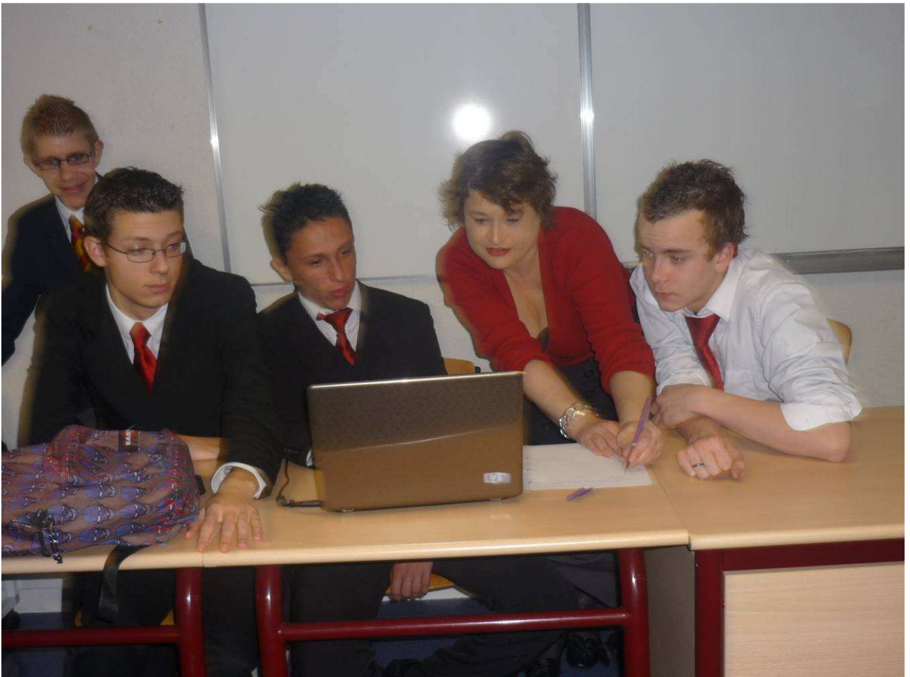
Travail sur les pays européens et l'animation avec Mme Ladhari